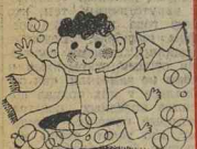
Рис. Л. ФИЛИППОВ