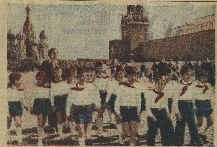
ИХ ПРИНЯЛИ В ПИОНЕРЫ НА КРАСНОЙ ПЛОЩАДИ! НА СНИМКЕ: ученики 73-й школы Красноперекопского района Москвы.